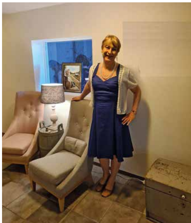
Hotellin viihtyisät sisätilat

Näemme taas lokakuussa, tai ainakin minua on vaikea estää tulemast!