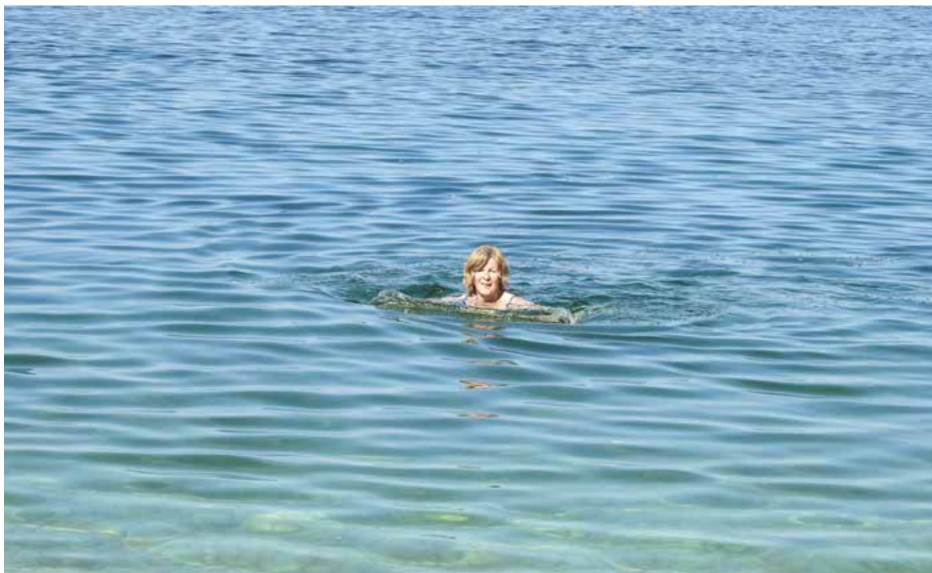
Michiganjärven lempeässä syleilyssä.