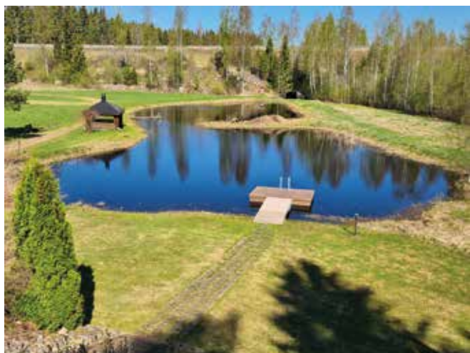
Näkymä saunan kuistilta