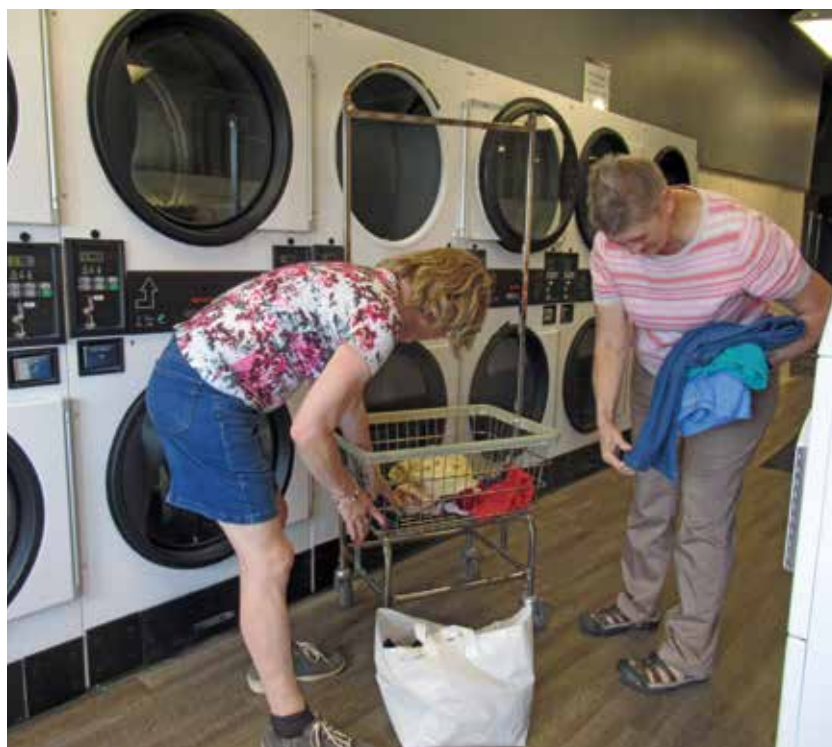
Vaatehuolto hoidettiin kylän pesulassa.

Chicagossa yövimme lentokenttähotellissa, josta oli kätevä Shuttle-yhteys kentälle. Sitä käytimme myös, kun lähdimme vierailulle kaupungin keskustaan. Lentokentältä on nimittäin sinne suora paikallisjunayhteys. Junan kunto