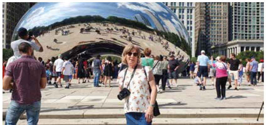
Millenium-puiston "papu", optisia ihmeitä tuottava taideteos