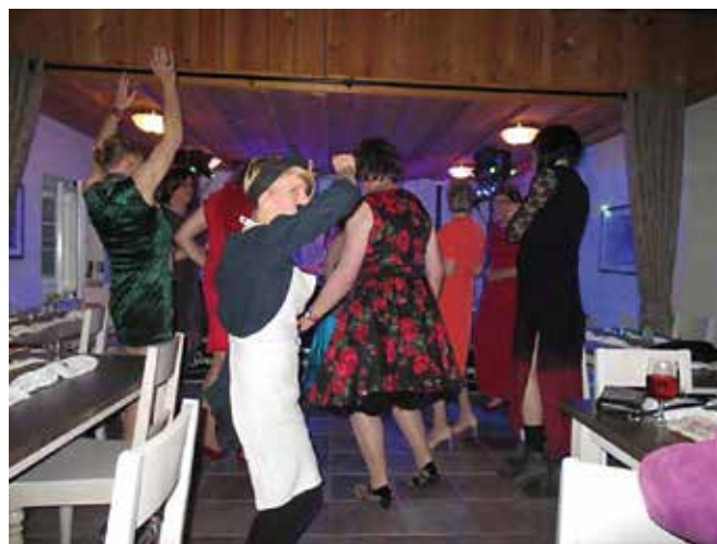
Alkuillasta tanssi sujui vielä rauhallisesti, loppuvaiheessa henkilökuntakin tempautui mukaan.