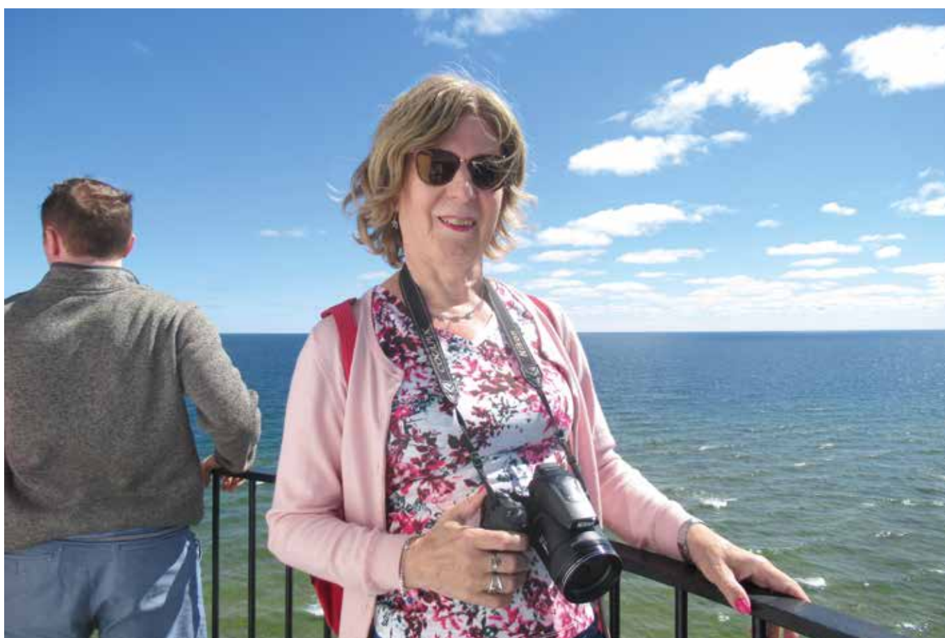
Näkymä ulapalle museomajakan huipulta.