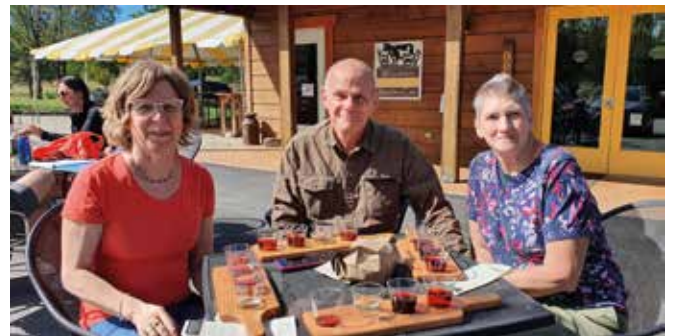
Paikallisia viinejä maistelemassa.

vielä juridisten miesten – käyttää naisten wc-tiloja. Pohjoisissa osavaltioissa, joissa vierailimme, tämä ei ollut ongelma. Toisaalta pieni ja siro olemukseni auttaa siinä, että kukaan tuskin tunnisti minua mieheksi helpotusta hakiessani.