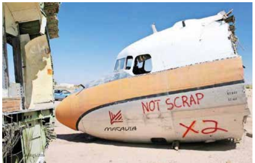
Kimin tuleva simulaattori irti sahattuna lentokoneiden hautausmaalla.

Lentämisen himoan Kim tyydyttää nykyään lentosimulaattorilla. Tässä asiassa hän ei tyytynytään ihan vähään, vaan hankki amerikkalaiselta lentokoneiden hautausmaalta nelimoottorisen DC-6 -matkustajakoneen etuosan ohjaamoineen pihalleen.