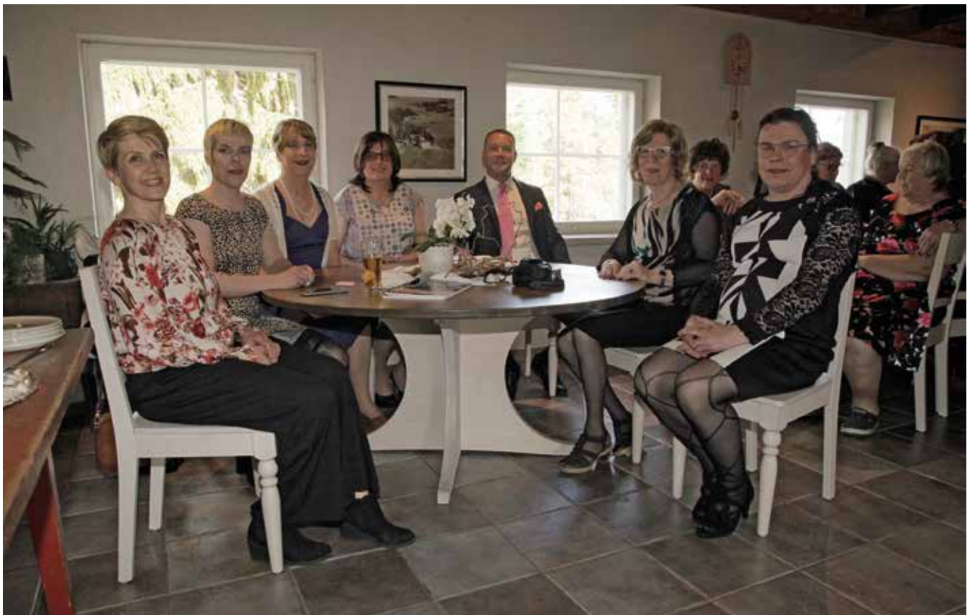
Kutsuvieraita ja DwC:n omaa väkeä kahvipöydässä.

Molemmat puheet olivat riemullista kuultavaa. Puheiden keskeiset kohdat voi lukea tästä lehdestä tuonnempana.