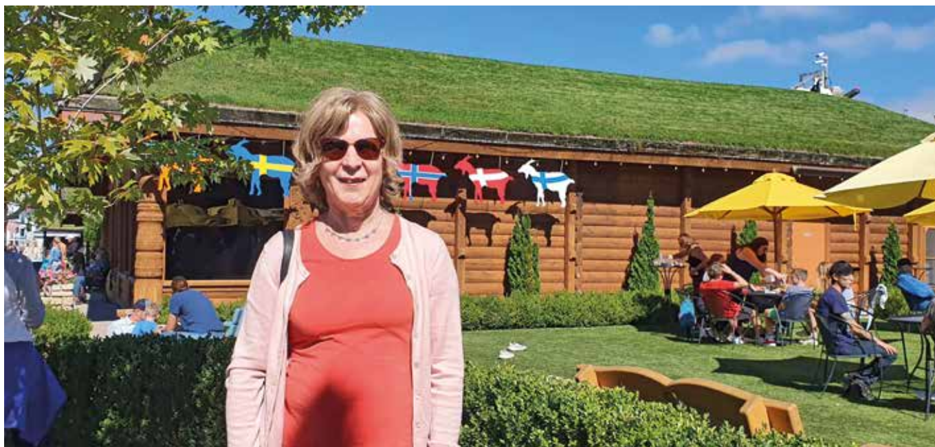
Pohjoismaista eksotiikkaa Sister Bayssa, vuohet ruohokatolla.