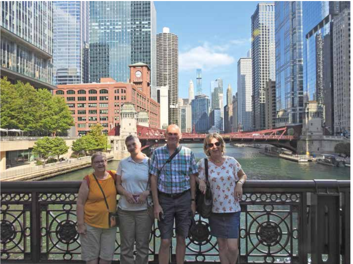
Matkaseurueemme Chicagon pilvenpiirtäjien katveessa.

hääseurueen takana olevalla seinällä, joten sitä en viitsinyt mennä ikuistamaan.