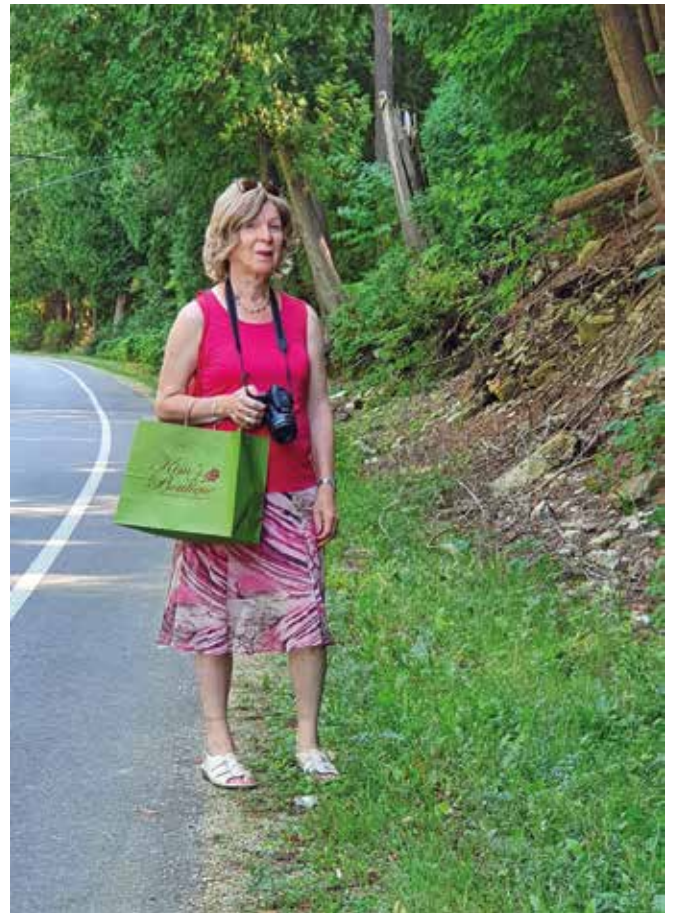
Yhdistetyllä luonto-shoppailumatkalla, ostokset Kimin muotiliikkeestä.

Ennen matkaa mietin myös kohdemaan vessapolitiikkaa. Ilmeni, että osavaltioilla oli suuria eroja siinä, sallitaanko transnaisten - tässä tapauksessa