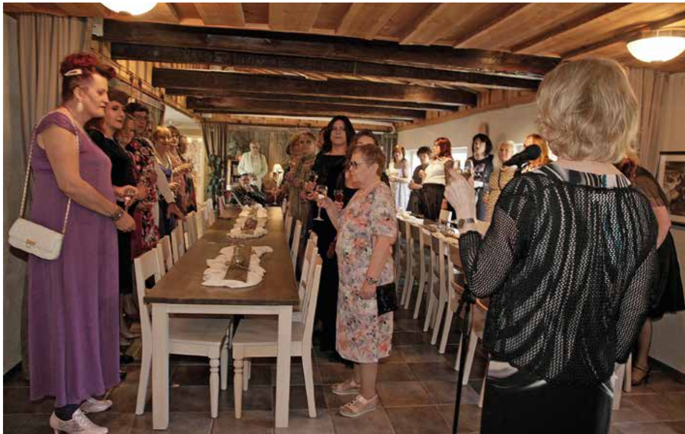
Malja 25+-vuotiaalle Dreamwear Club DwC ry:lle!

Dreamwear Club DwC ry:n 25-vuotisjuhlat jäivät pitämättä juhluvuonna 2021 koronarajoitusten vuoksi. Niinpä sitten vietettiin 25+-vuotisjuhla toukokuussa 2022, kun suuren joukon tapaaminen vihdoinkin taas sallittiin.