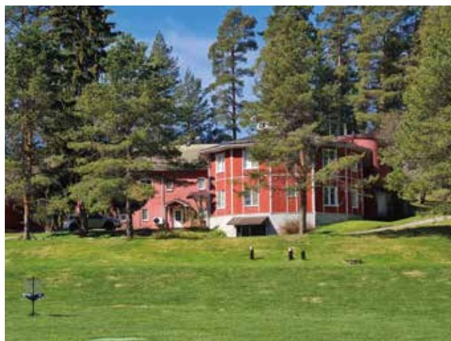
Päärakennus mäntyjen katveessa

Tapasin viikonloppuna ainakin pari uutta ihanaa ihmistä, joihin olen alkanut pitää yhteyttä. Yksi heistä oli todella innoissaan tästä ensimmäisestä ker-