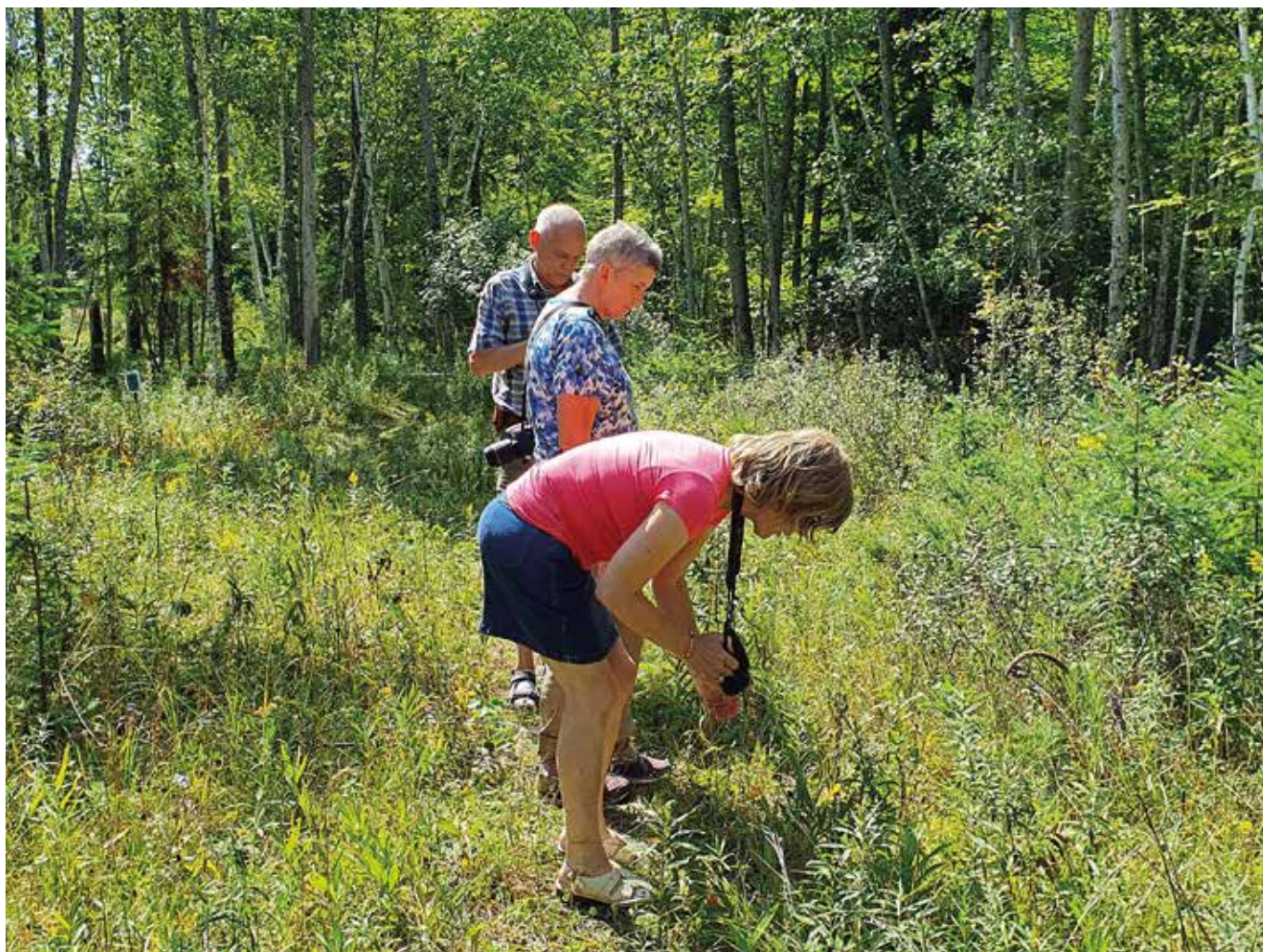
Luontoa tutkittiin joukolla.

Oltuamme Door Countyssä viikon verran palasimme Chicagoon. Matkan varrella näkyi maan siirtolaishistoria, ohitimme Luxemburgin, Brysselin ja monta muuta vanhalta mantereelta tuttua paikkaa. Poikkesimme syömään Milwaukeeen kaupunkiin, jota on luonnehdittu maan saksalaisimmaksi kaupungiksi. Se näkyi jo moottoritien varteen saksalaistyyppisissä kirkoissa ja lukuisina olutpanimoina. Ruoan nautimme Oktoberfest-tyyppiseksi ravintolaksi muutetussa tehdashallissa Milwaukee-joen varrella.