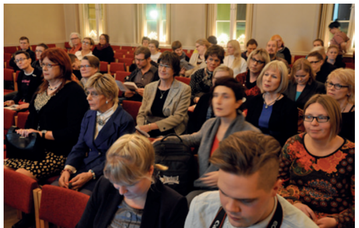
Edustavaa yleisöä, bongaatko tuttuja?

Kurkkaa netistä lisää http://transhelsinki.fi/index.php/2014-ohjelma/ https://www.youtube.com/user/SetaFinland https://www.youtube.com/watch?v=JWSOeMU6kRU