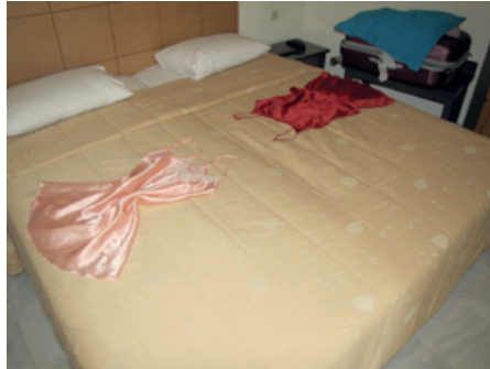
Yöasumme siivoojan jäljiltä

vietimme muutaman kilometrin päässä isommalla rannalla.