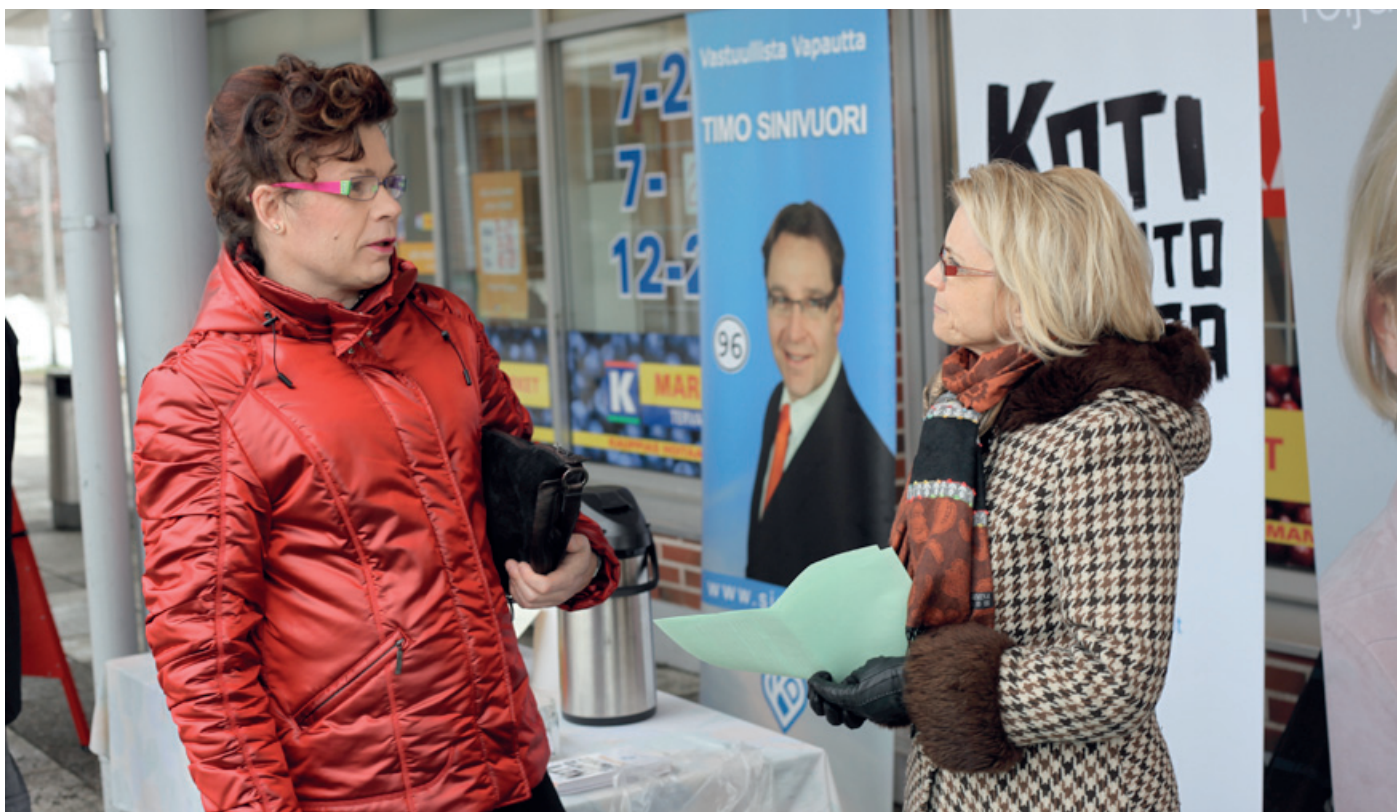
2011 "Ministerimittelössä" vastapuolena Päivi Räsänen. Molemmilla oma tukka.

massa. Jakkupuku ja kolmiväriset avokkaat toivat tarvittavan uskotavuuden, joka kasvoi kyseisessä ryhmässä edelleen, kun taustani osa-aikaisena maanviljelijänä paljastui! Ja kenkäfriikit eivät näköjään eduskunnassakaan pysty olemaan paljastumatta, sillä viestini saattoi sumentua, kun viestin kohde tuijotti herkeämättä sääriäni! Kun lakiehdotuksesta aikanaan vuoden 2014 lopulla äänestettiin, läpimeno varmistui noin-luvuin 150-30. Vastaan äänestivät vain perussuomalaiset. Oikeus käydä töissäkin naisten asussa sinetöity vihdoin ja viimein.