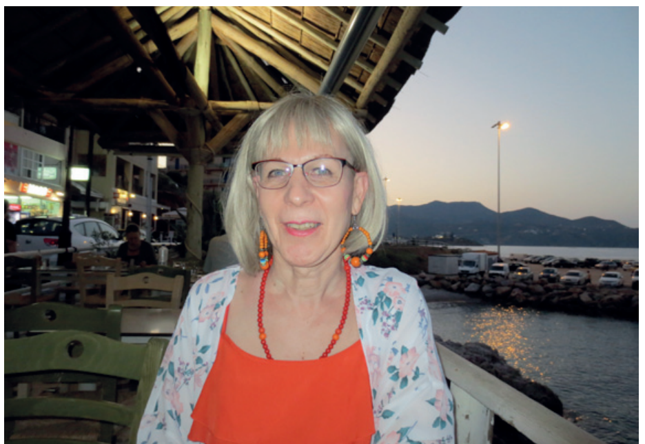
...ja taas syötiin....