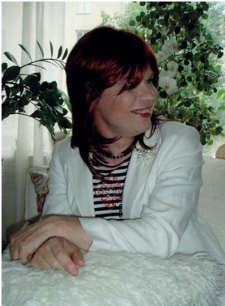
2008 Vielä peruukissa...

Kymmenen vuotta on kulu- nut siitä, kun törmäsin chatissa ensimmäiseen tiittiin. Keskinäi- nen jutustelumme johti lopulta siihen, että tieni vei helmikuussa 2006 ensi kertaa DwC:n kahvi- iltaan. Ilta oli sangen mielenkiin- toinen, eikä elämäni sen jälkeen ollut enää entisensä. Pari kahvi- iltaa samana keväänä vahvisti identiteettiäni, mutta yksi asia ihmetytti aivan valtavasti. Kun olin käynyt meikissä ennen iltaa ja pukeutunut nätisti, ja halusin seuraa kaupungille, niin muu porukka otti ja häipyi häntä koi- pien välissä autoonsa tahi meni puhdistamaan meikit kasvoil- taan illan loppuksi. Itse lähdin sit- ten yksin kaupungille syömään. En ymmärtänyt, miksi pelätä elää omana itsenään?