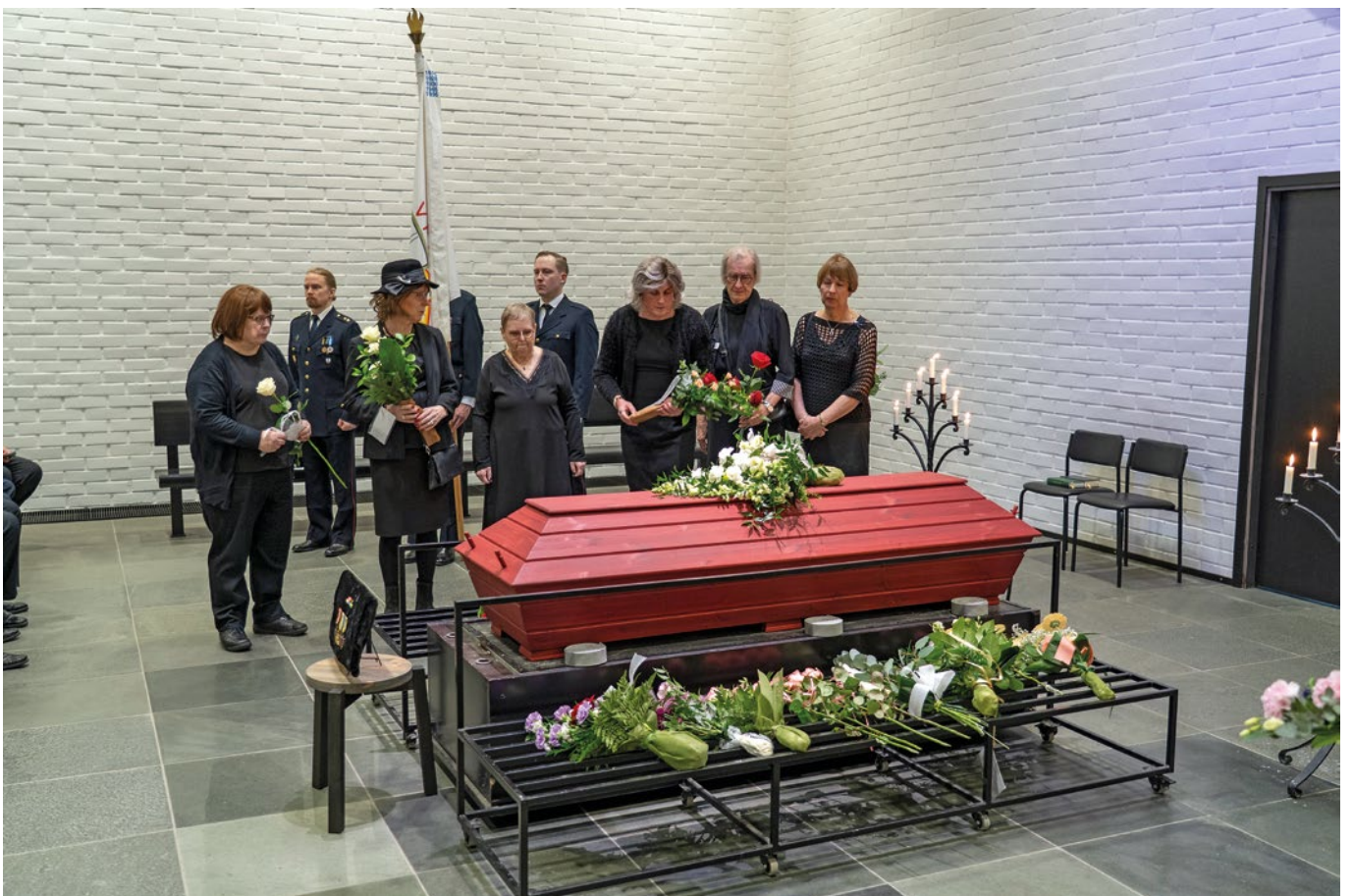
DwC:n väki laskemassa kukkia arkulle.