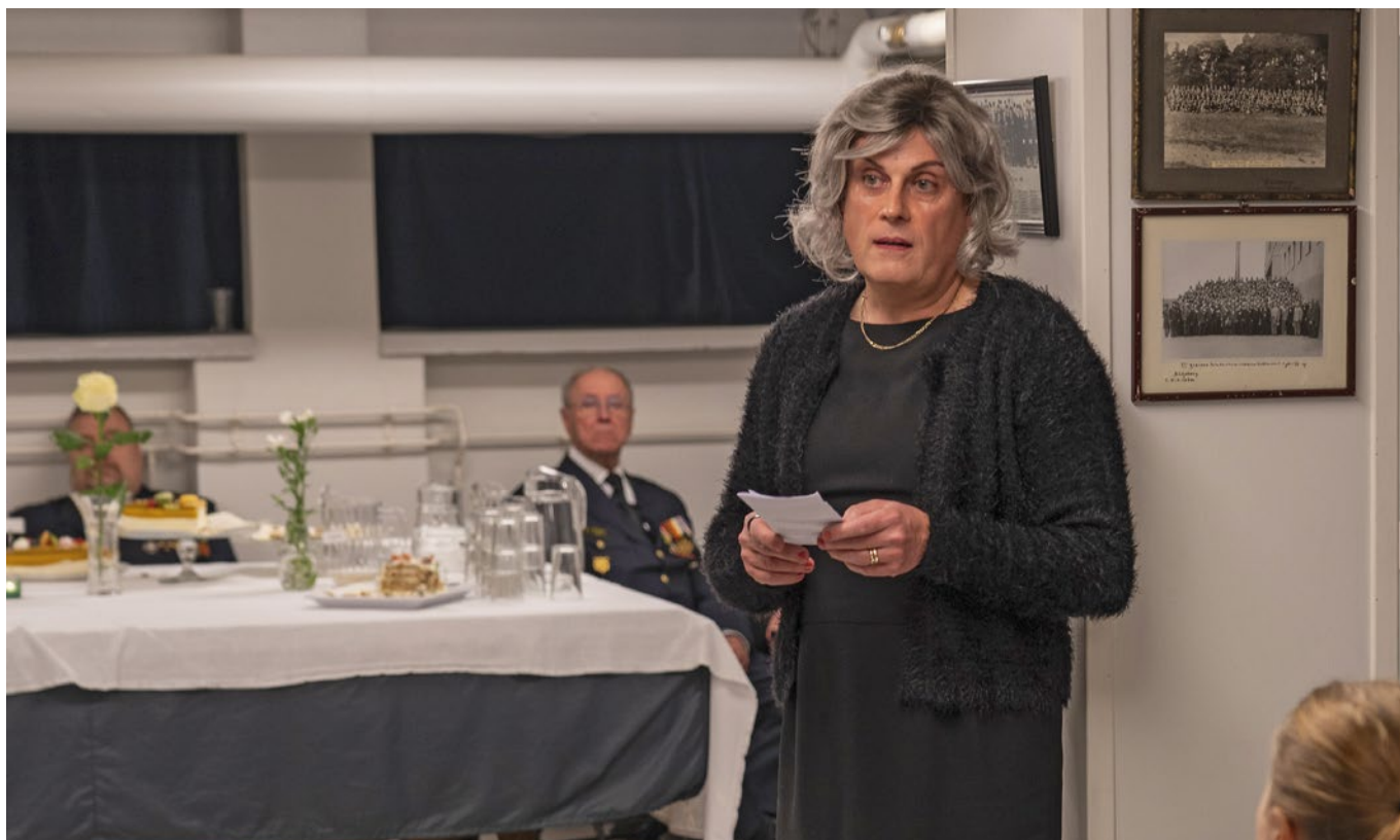
Ia lausumassa DwC:n muistosat