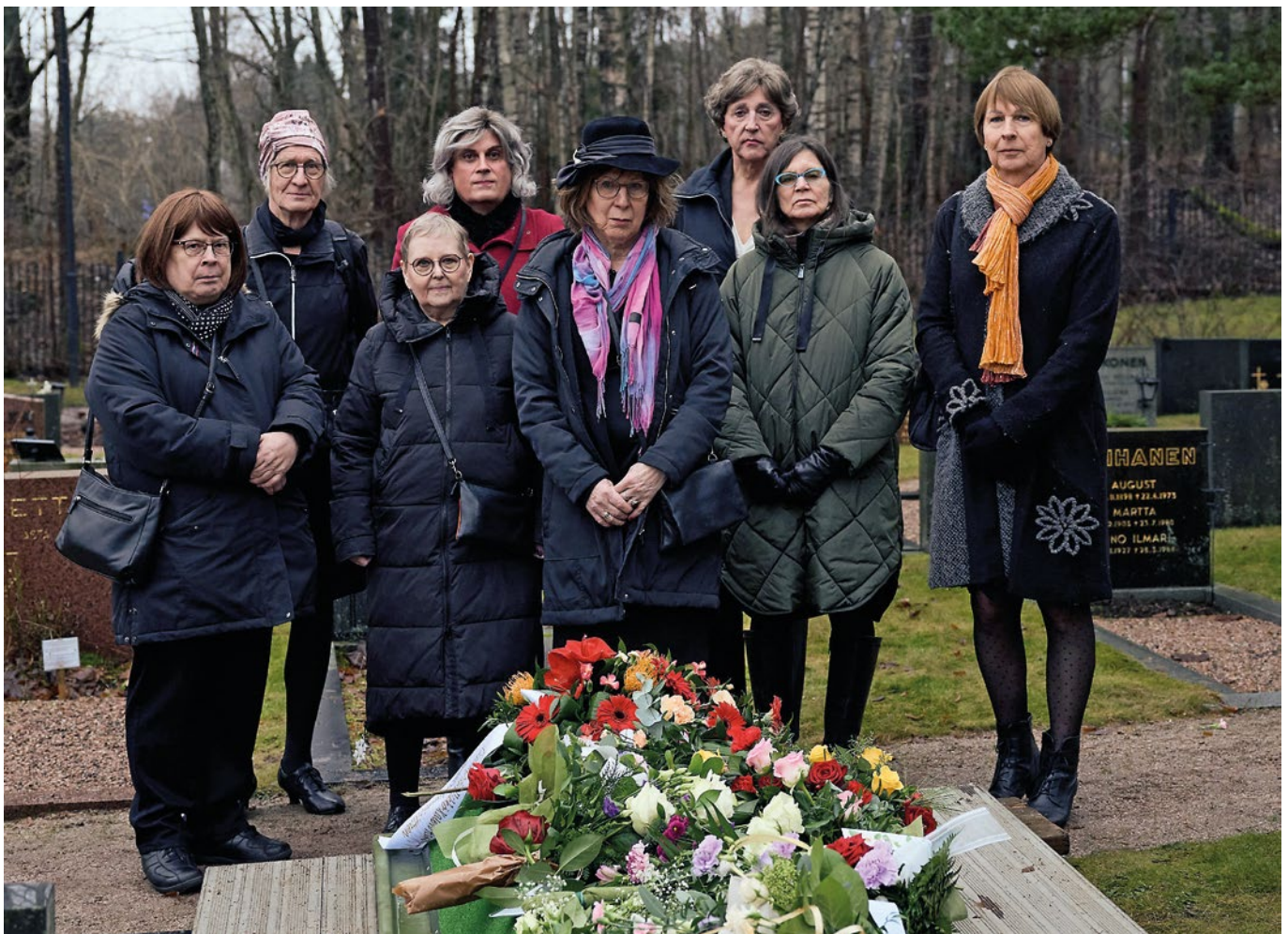
DwC:n jäähyväiset Thealle haudalla.