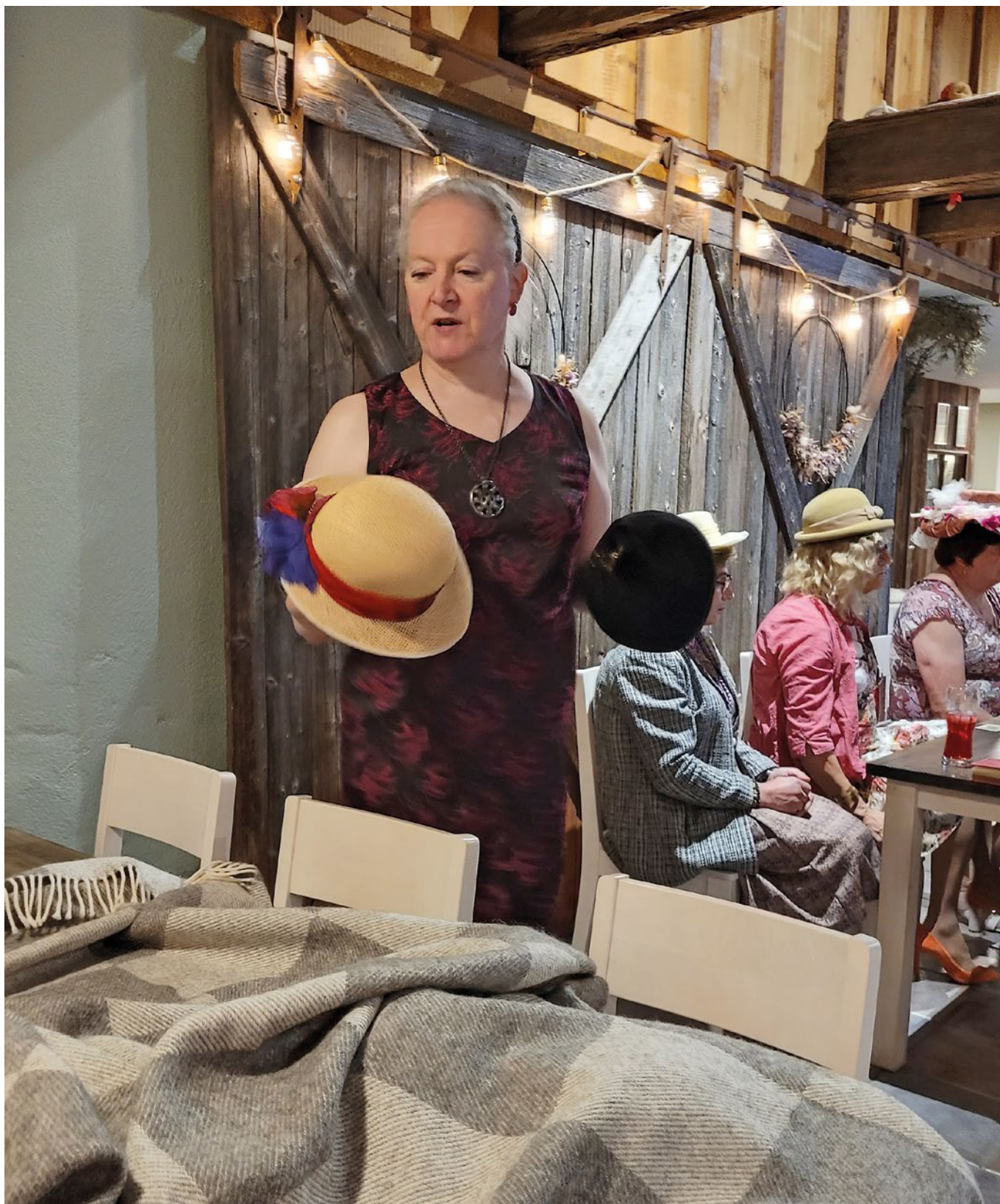
Syystapaamisen vieraita hatuttaa.