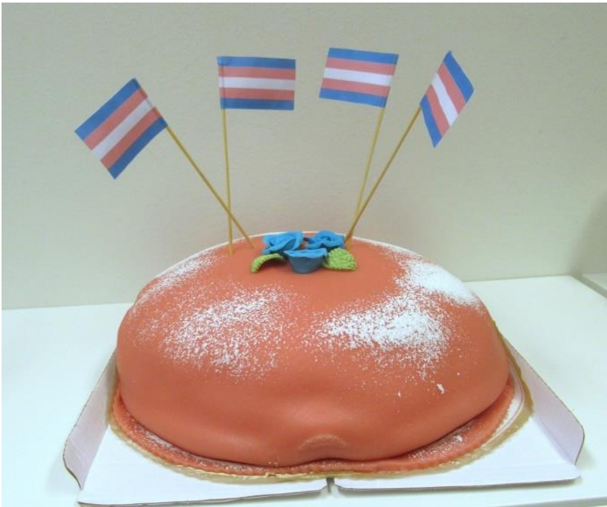
Dreamwear Club juhli translain läpimenoa aiheenmukaisella kakulla Helsingin vertaistukitapaamisessa 13.2.2023

Lakiuudistus laajentaa siis valinnanmahdollisuutta, missä suhteessa ja laajuudessa kukin siirtyy elämään omassa sukupuolestaan. Se helpottaa mm. lisääntymisen liittyvää suunnittelua, kun juridinen muutos ei enää edellytä lisääntymiskyvyttömyyttä. Jo aiemmin nimilain uudistus vuonna 2019 on jo lisännyt tätä valikkoa, kun etunimen saattoi vaihtaa omaa identiteettiään vastaavaksi ennen juridisia muutoksia. Suureksi ongelmaksi jäi edelleen lain binäärisyys - muunsukupuolisille ei ole lainkaan heille sopivaa juridista sukupuolta.