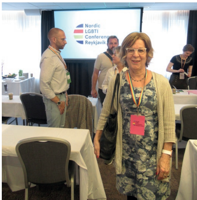
Jalkojen oikomista konferenssitauolla

Itse osallistuin työelämäsyrintään liittyvään työpajaan, jossa käsiteltiin pohjoismaista projektia tilanteen kartoittamiseksi. Raportti siitä julkistetaan tänä keväänä, ja osa sen Suomea koskevasta osios-