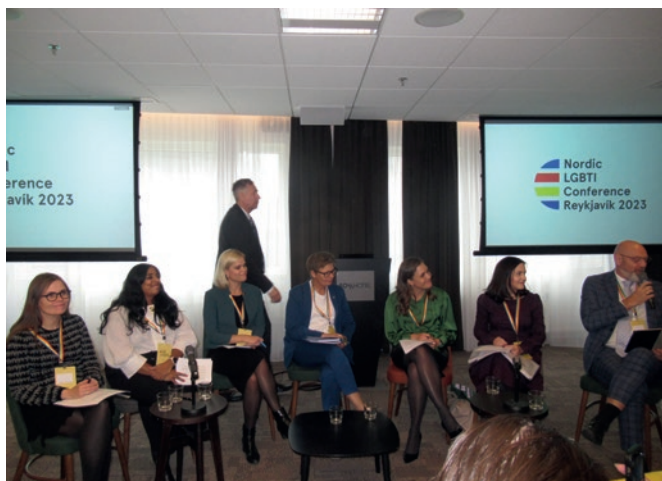
Pohjoismaiset tasa-arvoministerit haastateltavina.

alueellaan olevien alueiden ongelmista. Tanskan, Färsaarten ja Grönlannin valtuuskunnat pitivät huolta, että tietämättömyyteen ei voi vedota konferenssin jälkeen.