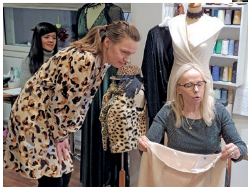
Kahvi-ilta Ompelimo Sormustimessa maaliskuussa 2024.