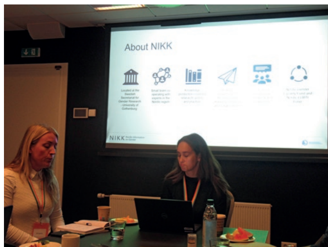
Ruotsalaiset kollegat työelämäseminaarissa

Lyhyinä vapaa-ajan jaksoina tutustuin itselle aiemmin tuntemattomaan Reykjavikiin. Tulopäivänä maanantaina ilmakin oli mitä ihanin. Kaupungin ydinkeskusta muodostuu pienehköistä ja paikoin viehkeistä liike- ja asuintaloista – vain muutama talo loi massiivisemman vaikutelman. Meren ran-