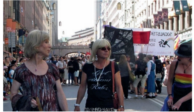
Tukholman Pride 2012.