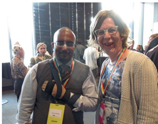
Tapaaminen Johanneksen kanssa Reykjavikin kaupungintalolla.