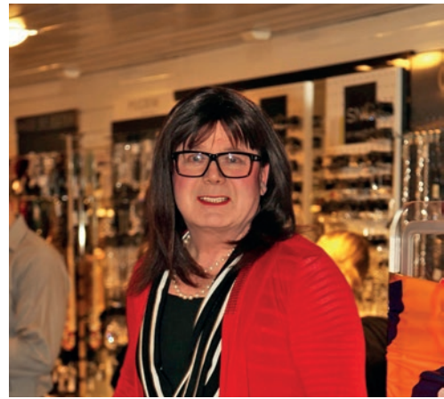
Ulla Silja Serenadella 2012.

”Minulla oli kova halu pukea siskojen muitakin vaatteita yksin ollessani, ja jopa pöhnin omaan käyttööni sellaisia vaatteita, joista huomasin, että niitä ei enää käytetty. Äiti löysi kerran vaatekätköni huoneessani olevasta varastokomerosta, ja kyseli raivostuneena, pidätkö sinä näitä päälläsi, vai miksi