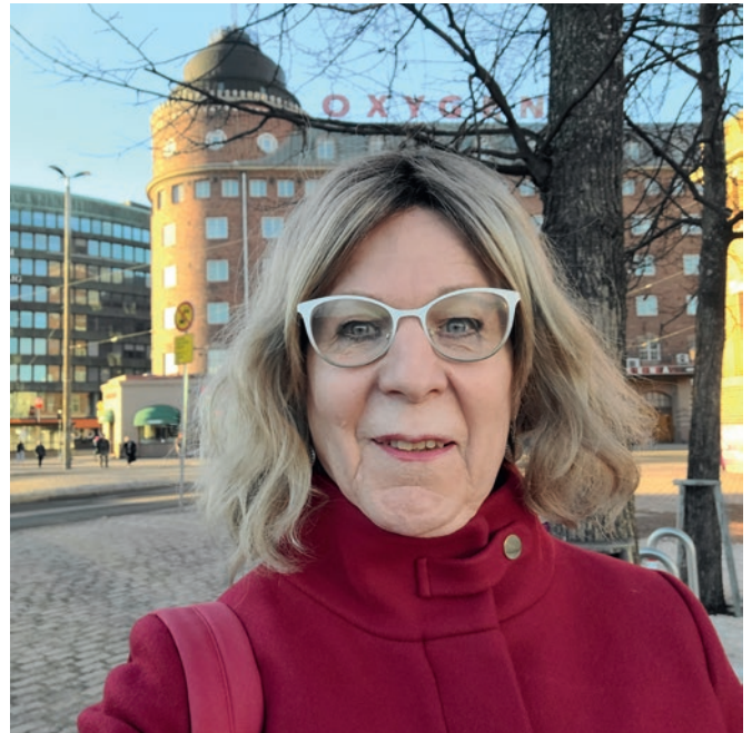
Matkalla Tasa-arvovaltuutetun toimistolle Hakaniemessä.

Syrjinnän kohteeksi joutuneen transihmisen on varsin vaikea hakea apua sieltä, mistä sitä olisi tarjolla: