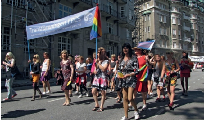
Stockholm Pride 2012.

Hirschfeldin ajattelua käsittelevän kappaleen päälähde on Magnus-Hirschfeld-Gesellschaftin sivuston esittely siitä: https://www.hirschfeld.in-berlin.de/institut/en/theorie/theo_01.html