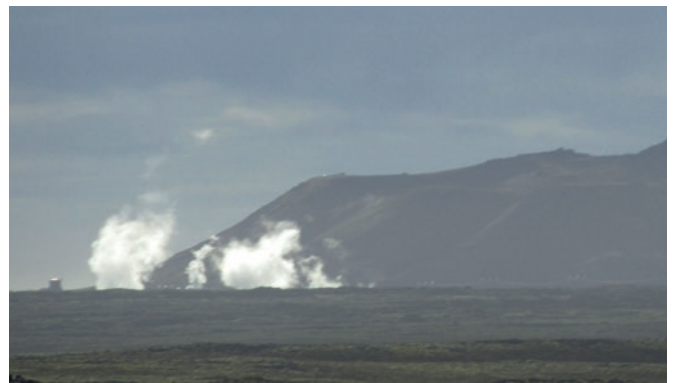
Geysireitä jouduin ihailemaan vain matkan päästä tiukan aikataulun takia.

Homo- ja transvastainen viha nousee pelosta ja hämmennyksestä erilaisuutta kohtaan, joka sitten kääntyy niin usein aggressioksi. Tällä hetkellä tätä vihaa käyttävät häikäilemättä hyväkseen kansainväliset uskonnolliset toimijat ja nationalistiset ja populistiset poliittiset liikkeet. Yhdenvertaisuustyön keskeinen tehtävä on tuoda nämä asiat tutuiksi ja arkipäiväisiksi, jolloin tällaiselta ajattelulta katoaa kasvualustaa.