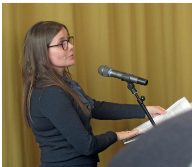
Katrín Jakobsdóttir Reykjavikin kaupungintalolla