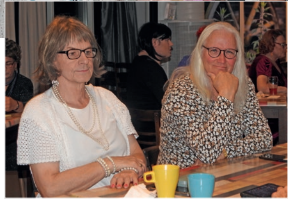
Oriveden syystapaamisen 2023 tunnelmia.