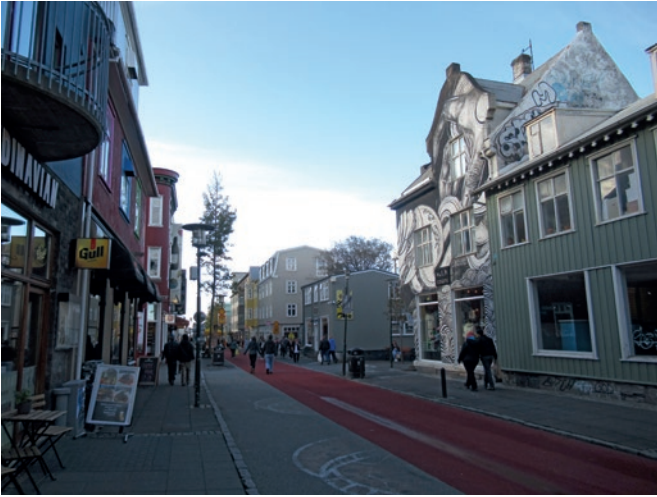
Vanha pääkatu vanhoine puutaloineen

taan oli toki rakennettu mahtipontista uutta liikekeskustaa, jota välttelin johdonmukaisesti.