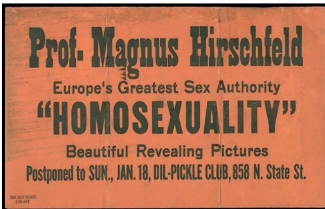
Mainos vuodelta 1931.

Kansainvälisessä lehdistössä Hirschfeldiä lainattiin ja myös pilailtiin äänekkäänä seksuaaliasioiden asiantuntijana. Hearst-konserni tuki hänen kiertuettaan ” Seksin Einsteinina ”, koska katsoi sensaation myyvän. Lopulta lehdet kaivoivat lisäsensaatona