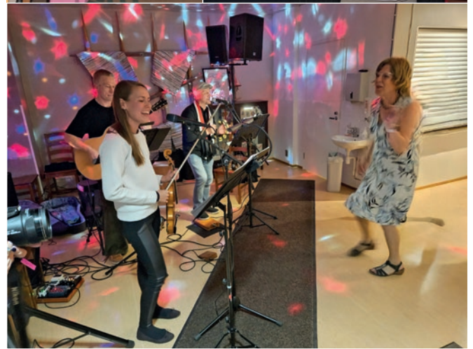
Oriveden syystapaamisen 2023 ohjelmaa.